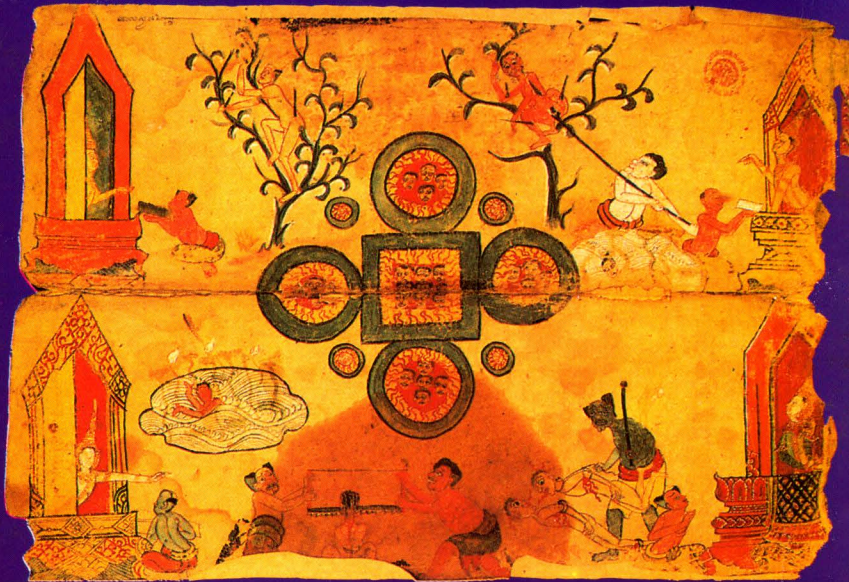
ภาพสุดท้ายนรท