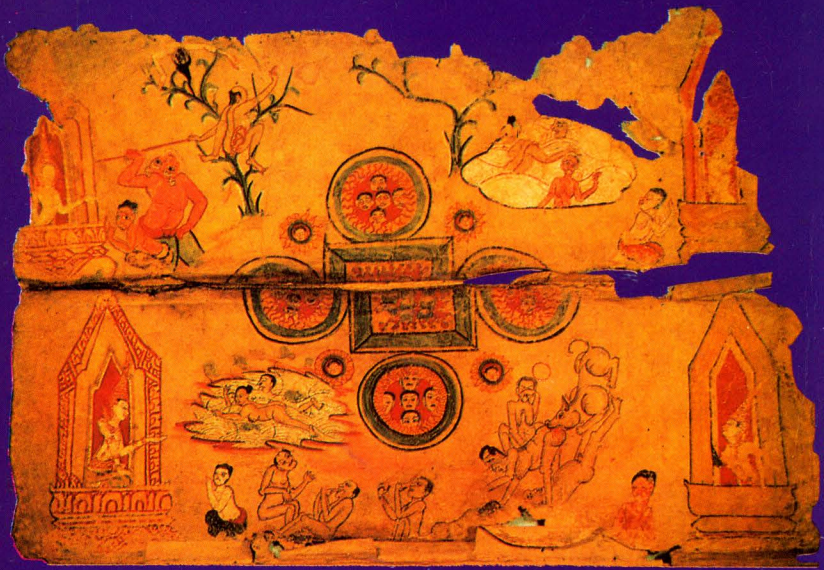
ลัญชีวนรท